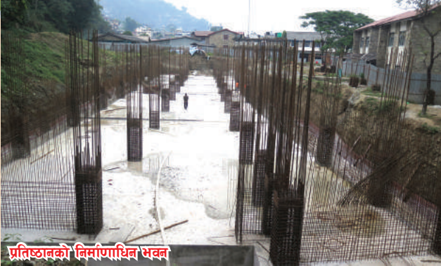
प्रतिष्ठानको निर्माणार्थिन भवन

२०७७ साल फागुन १७ गते निर्वर्तमान प्रधानमन्त्री श्री के.पी. शर्मा ओलीबाट शिलान्यास भएको प्रतिष्ठानको भवनको निर्माण कार्य भई रहेको छ । हाल उक्त भवनको जगको काम सम्पन्न भई भूईँतलाको काम भइरहेको छ । भूईँतला सहित चार तले उक्त बहु-उद्देश्यीय भवनमा बैठक कक्ष, तालिम हल, सभा हल, चमेनागृह, अनुसन्धान कक्ष र भवन परिसरमा पार्किङ समेतको व्यवस्था हुनेछ । प्रतिष्ठानलाई प्रदेश सरकारको उत्कृष्ट ज्ञान केन्द्र (Center for Excellence) को रूपमा अगाडि बढाउने लक्ष्य अनुसार यो भवन निर्माण भएको हो ।