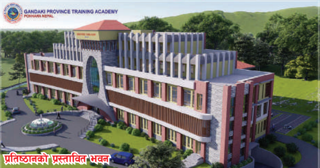
प्रतिष्ठानको प्रस्तावित भवन